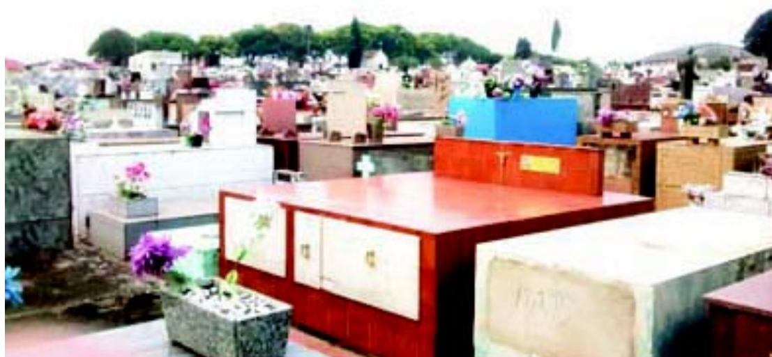
Cemitério Municipal "Cristo Rei", na área central, tradicionalmente recebe maior número de visitantes.