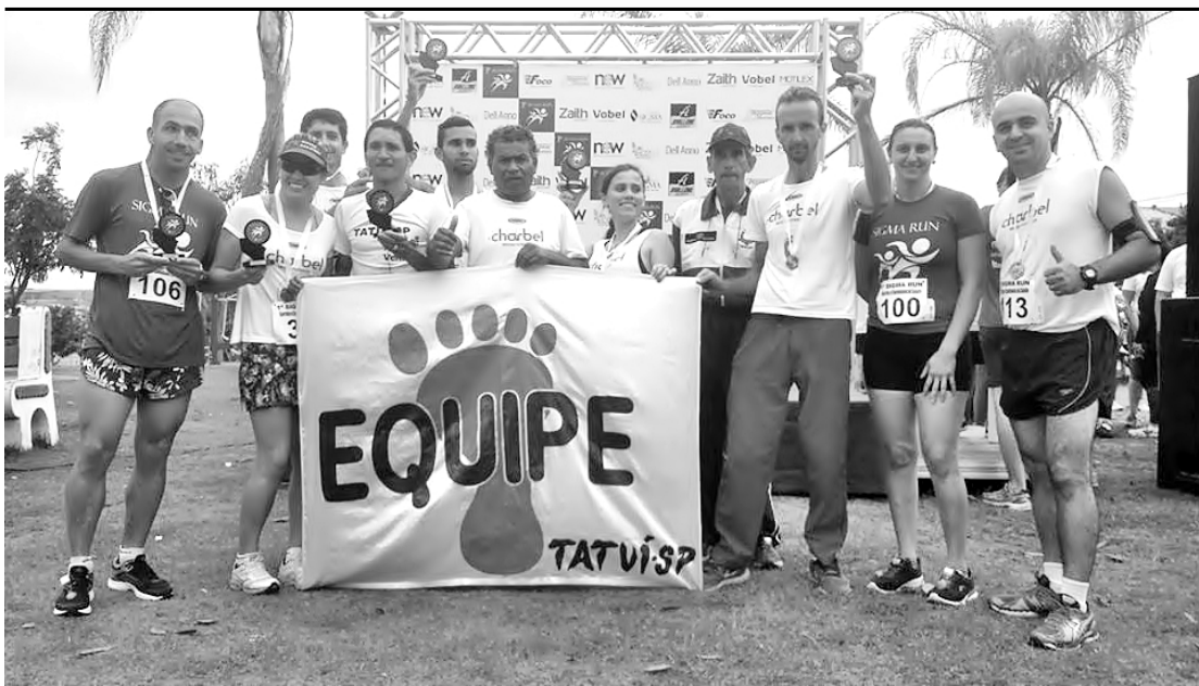
A Equipe “Pé Vermelho” foi um dos destaques da corrida realizada no último domingo.

Diversos atletas de Tatuí ocuparam o pódio nas categorias da “1ª Corrida e Caminhada da Saúde Sigma Run”, realizada no último domingo (4), com largada e chegada na Praça Ayrton Senna, na Vila Dr. Laurindo. A prova, organizada pela Clínica Sigma, apresentou percursos de cinco e dez quilômetros na corrida e três quilômetros na caminhada.