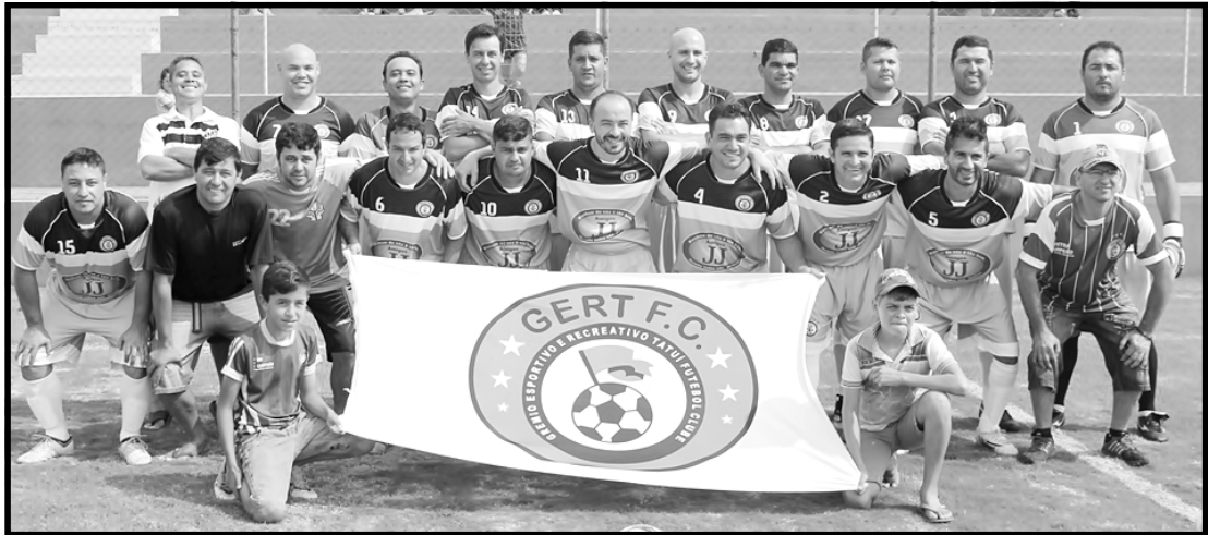
Gert busca pentacampeonato e abre fase semifinal na categoria veterana.

Estão definidos os semifinalistas nas três categorias da “15ª Copa Rádio Notícias de Futebol Master”, promovida pela Central de Rádio de Tatuí. A nova fase do campeonato terá início dia 18 de outubro e termina dia 22 de novembro. Haverá um jogo por domingo, sempre a partir das 9h30, com entrada gratuita. As finais também já estão agendadas. Elas deverão ser disputadas dias 29 de novembro (Categoria Veterana), 6 de dezembro (Categoria Veteraníssima) e 13 de dezembro (Categoria Super Veteraníssima).