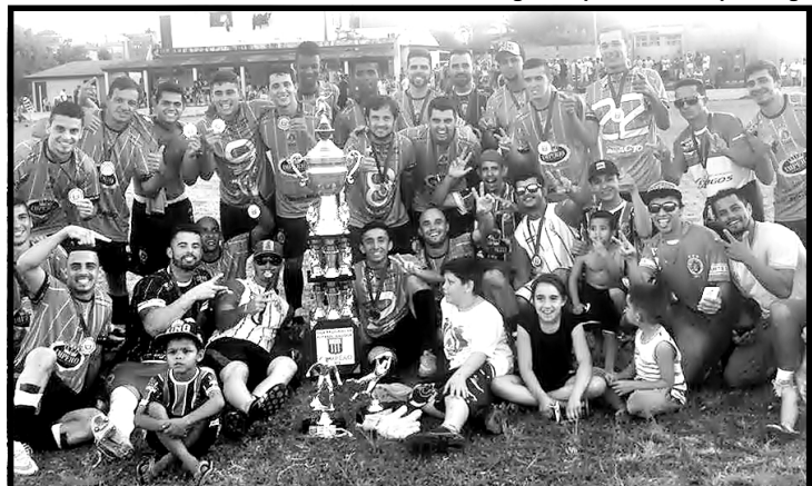
Jogadores do Santa Rita levantaram a taça com duas vitórias nas partidas decisivas.