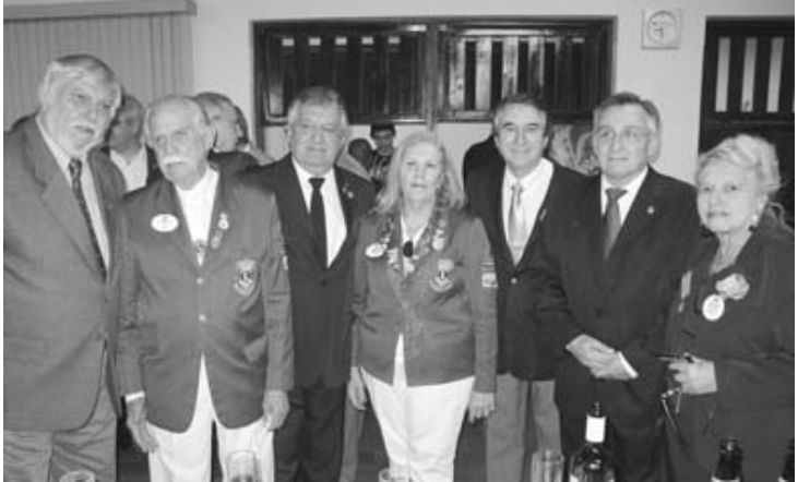
Lions de Tatuí prestigia visita da governadora a Cerquilloho.