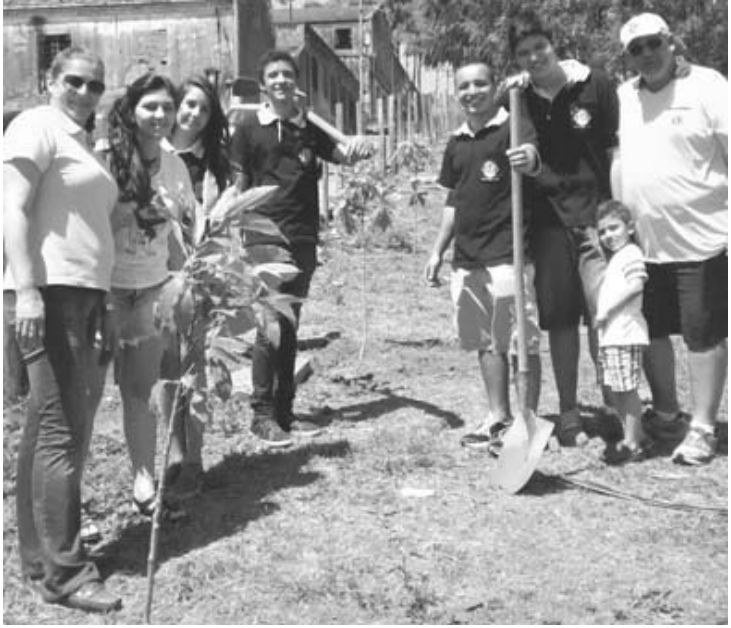
Membros do Lions preocupam-se com limpeza e preservação do meio ambiente em Tatuí.

Na manhã do sábado (19), integrantes do Lions de Tatuí e do LEO Clube, entidade ligada a este clube de serviços, que congrega a juventude, participaram de uma ação de preservação e cuidado com o meio ambiente, às margens do Ribeirão do Manduca.