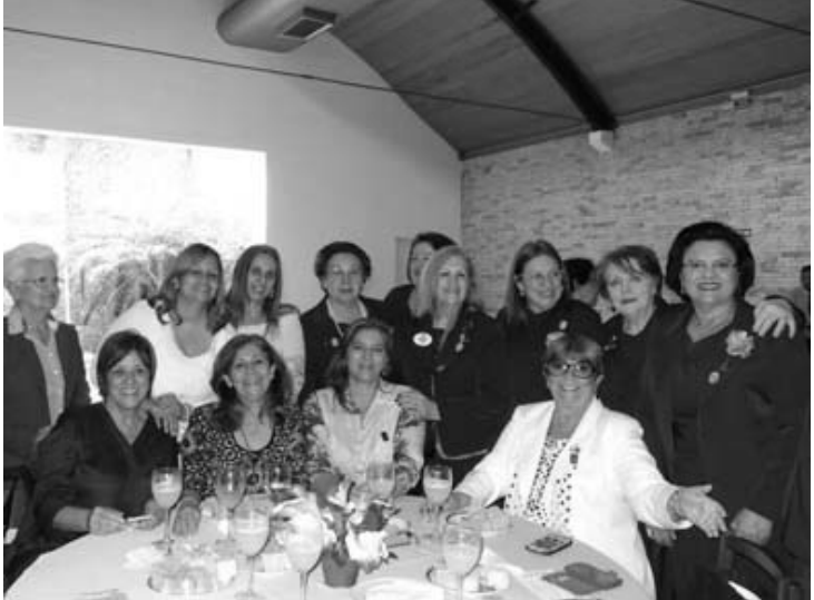
Senhoras do Lions presentes no chá beneficente na Capital.