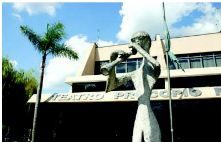
Festival está agendado para dia 11 de outubro no Teatro Procópio Ferreira.

Dia 11 de outubro, das 13 às 17 horas, no Teatro "Procópio Ferreira", do Conservatório de Tatuí, a "Comunidade Católica Missionária Recado" promove o "Festival Recado de Música Católica 2015", que tem como objetivo descobrir e revelar novos talentos da música católica brasileira, além de lançar músicas inéditas, compostas e interpretadas por cantores ou grupos ligados à Igreja Católica. Entre os inscritos, o comitê organizador do evento selecionará dez músicas autorais e cinco intérpretes para a segunda etapa, para apresentação ao público no palco do Conservatório.