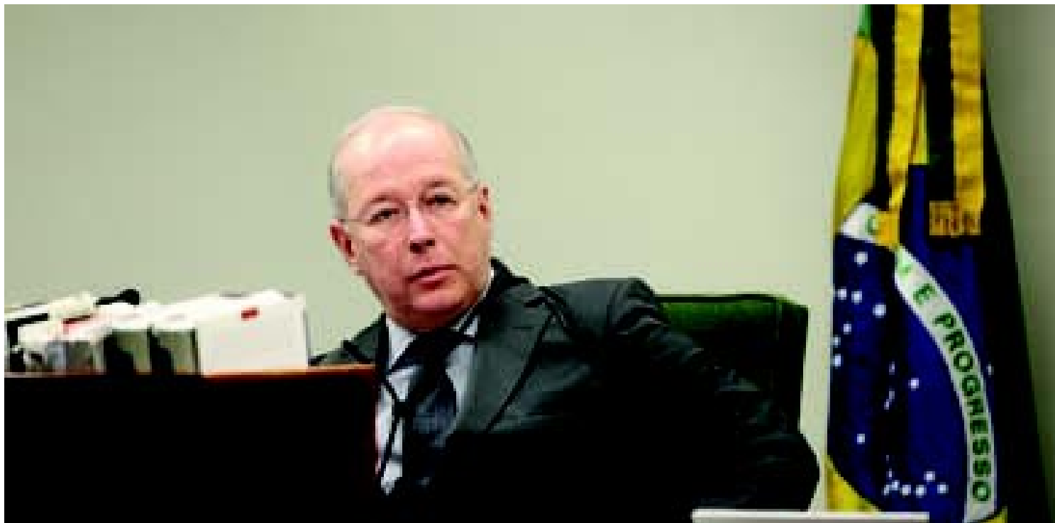
Ministro preside sessão da Segunda Turma.

"Somos um povo honrado governado por ladrões". Escrita por Carlos Lacerda, na Tribuna da Imprensa, em agosto de 1954, foi a frase que o ministro Celso de Mello, o mais antigo ministro do Supremo Tribunal Federal (STF), declarou durante o julgamento de um habeas corpus impetrado por Fernando Baiano, preso na Operação Lava Jato, que apura o maior escândalo ocorrido em toda a história da Petrobras. O ministro tatuiano deseja que a frase publicada por Lacerda, poucos dias antes do suicídio do presidente Getúlio Vargas, não reflita o atual momento político brasileiro.