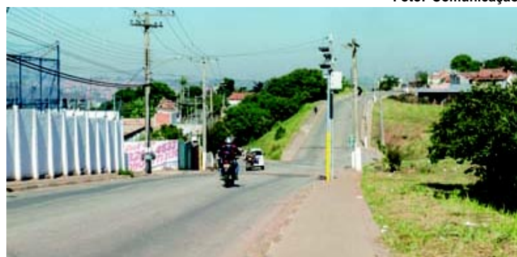
Equipamento instalado na Vila Santa Luzia.