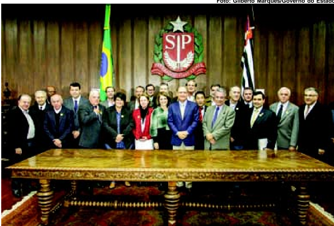
Governador Geraldo Alckmin em foto oficial da solenidade.