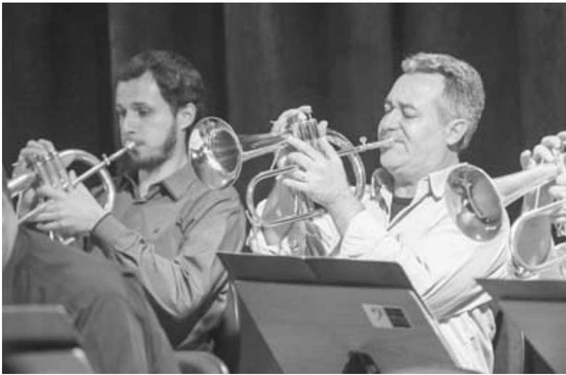
Big Band.