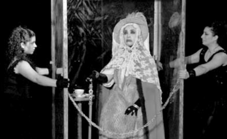
Grupo Folias.