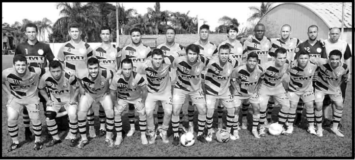
Equipe ganhou título regional invicto em Cesário Lange.