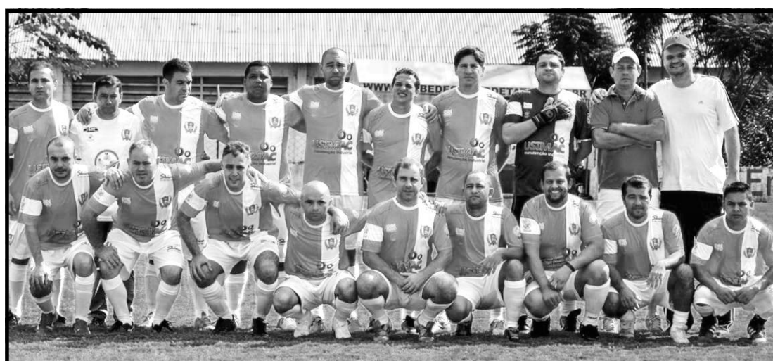
Ressaquinha conquista seu primeiro ponto na competição.