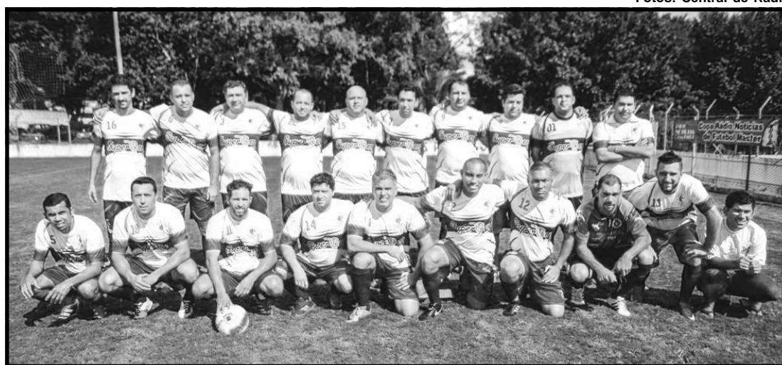
Clube de Campo empata na estreia do campeonato.

Na categoria veterana, os seis times foram divididos em dois grupos, da seguinte forma: "A" – Sexta Master, Laurindense e São Cristóvão; "B" – XI de Agosto, Clube de Campo/Áz de Ouro e Associados do Clube. Na primeira fase, as equipes se enfrentam entre si, dentro de seus grupos, em dois turnos, e as duas