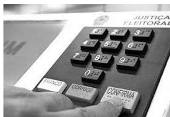
Cartório Eleitoral prepara eleição municipal de 2016.

Caso o eleitor já esteja com o título cancelado ou não tenha feito a revisão biométrica (nos municípios onde houve biometria), deverá fazer o