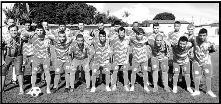
Equipe de Tatuí começa campeonato com vitória por 2x0.