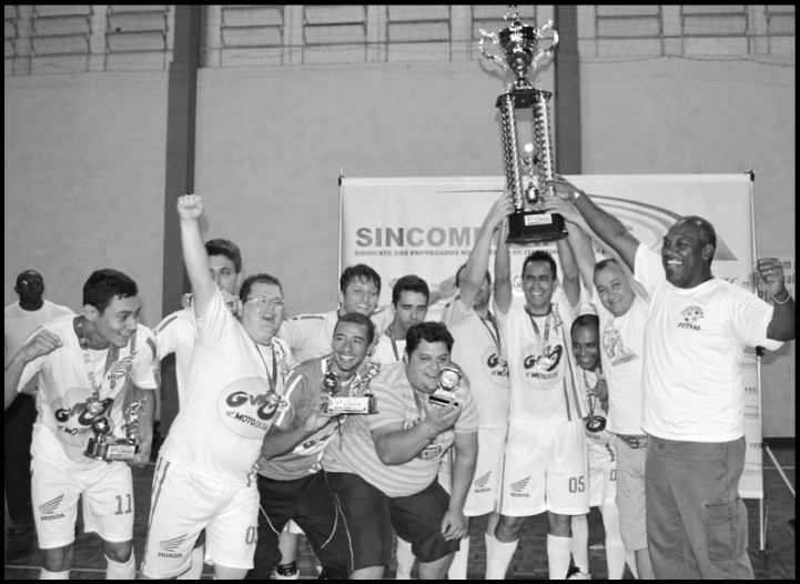
Jogadores da Honda Moto Guia comemoram a conquista.

Paulista, ao lado do Rio Branco (Americana), Velo Clube (Rio Claro), Lemense (Leme), Internacional e Independente (ambos de Limeira). Na primeira fase, as equipes se enfrentam em dois turnos. A estreia na competição ocorrerá dia 17 de maio, contra a Lemense, na cidade de Leme. Depois, pelo primeiro turno, o Guarani jogará diante da Inter de Limeira (dia 24/05), Velo Clube (dia 31/05), Independente (dia 07/06) e Rio Branco (14/06). O campeonato é organizado pela Federação Paulista de Futebol e conta com 42 equipes na categoria Sub-11.