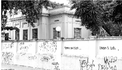
Muros da Escola “João Florêncio” estão tomados por pichações.

A Prefeitura de Tatuí sancionou a Lei Municipal nº 4.928, que institui o “Programa de Combate à Pichação e aos Atos de Vandalismo” na cidade. O projeto foi aprovado pela Câmara Municipal na sessão do dia 3 de março. A partir