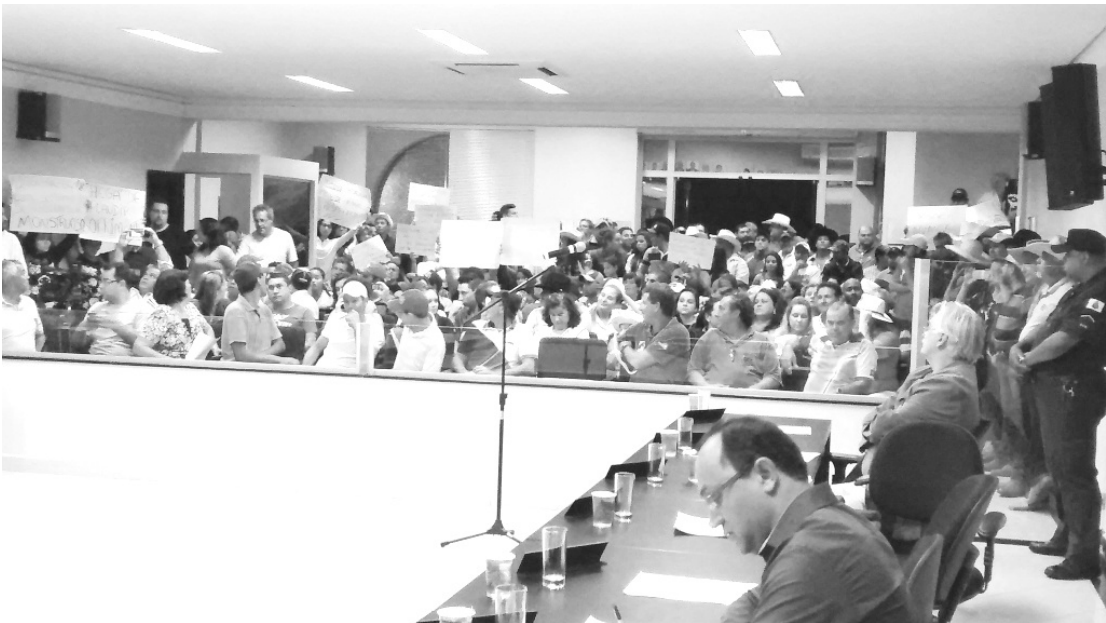
Público acompanha a votação do projeto na sessão da Câmara.

A votação do projeto ocorreu de forma nominal. A proposição recebeu treze votos