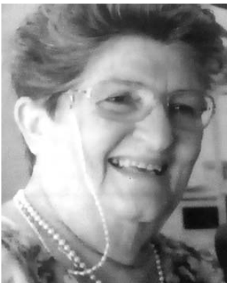
novação Carismática Católica de Tatuí.