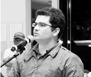
edil quer saber onde e como o dinheiro foi aplicado.