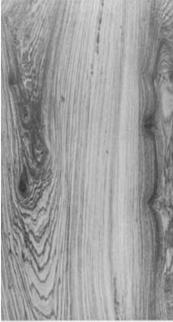
Revestimento “Guajuvira”, lançamento da Cerâmica Strufaldi.

A “Expo Revestir” será realizada no Transamérica Expo Center, em São Paulo, e estará aberta ao público das 10 às 19 horas. A Cerâmica Strufaldi, que vem ampliando sua linha de produção, irá expor seus