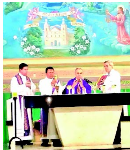
Bispo Diocesano celebra “Missa de Cinzas” na Igreja Matriz de Tatuí.

Quaresma - A Quaresma é o período do ano litúrgico que antecede a Páscoa Cristã. Começa na Quarta-Feira de Cinzas e termina no Domingo de Ramos, anterior ao Domingo de Páscoa. É um tempo onde os cristãos dedicam-se à reflexão, penitência, conversão espiritual, abstinência, jejum e orações, para lembrar os quarenta dias passados por Jesus no deserto e os sofrimentos que suportou na Cruz. É uma época de reconciliação com Deus, quando ocorrem as confissões em todas as paróquias, para os fiéis pedirem o perdão de seus pecados e preparar-se para as celebrações da Semana Santa.