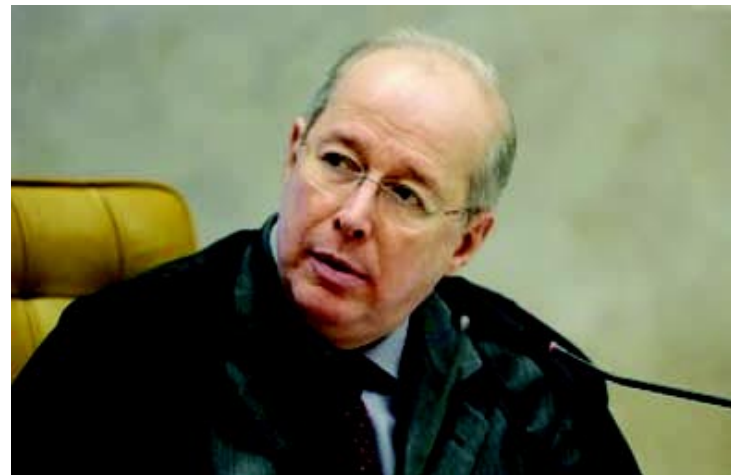
Ministro Celso de Mello pode ficar até o dia 31 de outubro no STF.

O nome do ministro do STJ (Superior Tribunal de Justiça) Benedito Gonçalves ganhou força para ocupar vaga deixada por