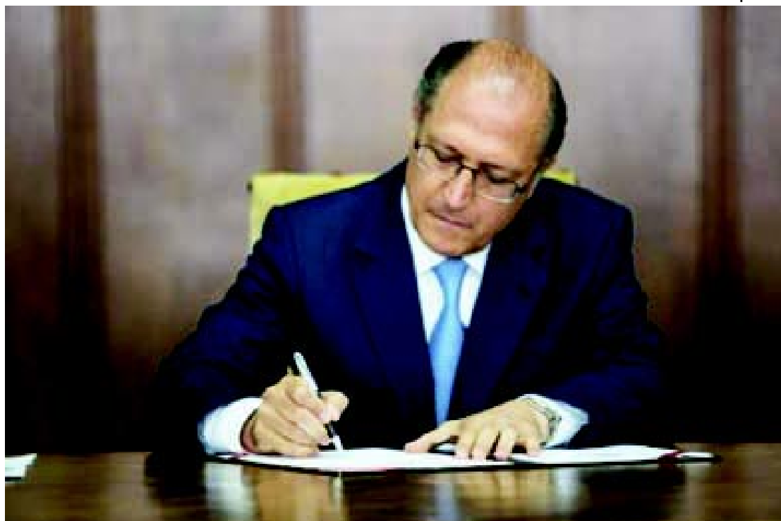
Geraldo Alckmin incentiva o setor sucroenergético paulista.