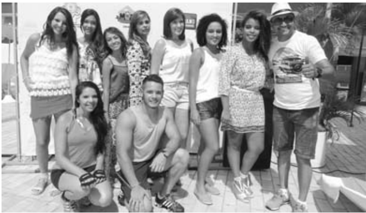
Os participantes do "desfile de moda verão".