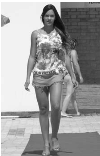
Modelo desfila na Associação Atlética XI de Agosto.

Idealizado pelo animador e locutor Alexandre Bossolan, este projeto tem como objetivo reunir os associados dos clubes de Tatuí e oferecer a eles um dia de lazer e entretenimento. Nesta temporada, o projeto "Mais Verão" ocorre em três clubes, com diversas atrações artísticas e recreativas, como desfile de moda, apresentações de dança, dicas de saúde e alimentação, som mecânico com DJs, gincanas com sorteio de brindes e animação com locutores. Dia 18 de janeiro, o projeto foi desenvolvido na Associação Atlética XI de Agosto, e no dia 25, no Cat-Sesi "Wilson Sampaio". Neste domingo (1º), será a vez do Clube de Campo.