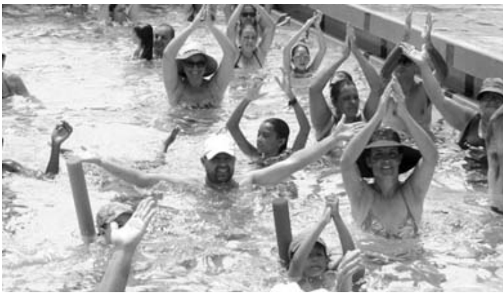
Associados divertem-se com aula de hidroginástica.