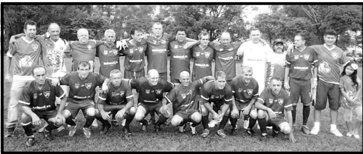
São Martinho é o atual campeão desta disputa futebolística.

No domingo (11), começou em Tatuí o "9º Campeonato de Futebol José de Campos", que presta homenagem ao saudoso "Zé Leiteiro". Esta competição, idealizada por Cesário Mota Filho, o Tatu, é organizada pela Secretaria Municipal de Esportes e disputada na categoria veteraníssima, para atletas acima de 50 anos de idade.