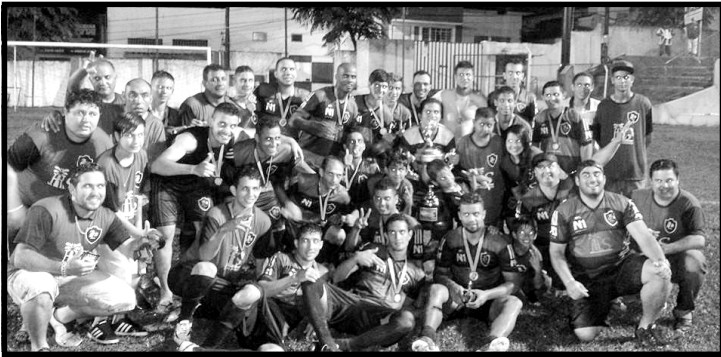
HS Poços Artesianos comemora título no futebol de verão.

Em dezembro, o Esporte Clube São Martinho encerrou a 19ª edição do "Campeonato de Futebol de Verão", promovido no Estádio "J.R. do Amaral Lincoln". A competição foi disputada por 16 times e a decisão reuniu HS Poços Artesianos e FBA. A equi-