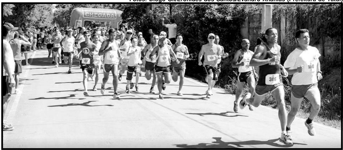
Atletas disputam "São Silvestre Tatuiana" no Bairro dos Mirandas.