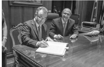
Deputado Samuel Moreira permanece no exercício do governo durante a viagem do governador Geraldo Alckmin.

Na segunda-feira (10), Samuel Moreira (PSDB), deputado federal eleito e mais votado em Tatuí no último pleito, com 16.222 votos, que atualmente ocupa o cargo de deputado estadual e preside a Assembleia Legislativa de São Paulo, assumiu o cargo de governador do estado, durante a viagem oficial do governador Geraldo Alckmin aos Estados Unidos, com o objetivo de buscar financiamento para obras rodoviárias. Samuel Moreira permaneceu no posto até quinta-feira (13). Ele assumiu o governo em razão de o vice-governador, Guilherme Afif Domingos, também se encontrar em viagem no exterior. Durante a sua ausência no parlamento paulista, Samuel foi substituído pelo deputado estadual Chico Sardelli (PV), 1º vice-presidente.