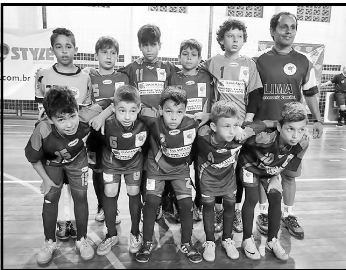
Tatuianos fizeram bonito no tradicional campeonato.