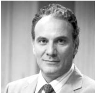
Fernando pergunta a Mário a identidade do homem com quem Gilda está saindo.

Segunda-feira – Artur insinua para Elísio que Beatriz tem um amante. Vitória tenta convencer Pedro a esquecer Sandra. Rafael volta para a casa de Inês para pegar seu passaporte. Cristina teme que Mário se afaste dela e decide ir atrás do marido. Célia conta para Sandra sobre a vingança de Artur, e a moça desiste de viajar com Rafael. Elísio questiona Beatriz sobre a sua relação com Paulo. Vitória deixa a casa de Gilda. Mário expulsa Cristina da agência. Elísio pede que Beatriz saia de sua casa. Ricardo se preocupa com o sumiço de Dani e Rodrigo. Inês comenta que Sandra e Rafael não viajaram, e Pedro avisa a Vitória. Vitória chega à casa de Beatriz com suas malas.