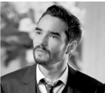
José Pedro afirma a Maria Marta que Cristina não descobrirá nenhum desfalque na empresa.

Sábado – Maria Inês torce para que Laura esteja fazendo a coisa certa ao aceitar se casar com Marcos. Sueli não gosta de saber que passará a trabalhar na recepção do hospital. Pepito encontra o anel de Laura no vaso de plantas do hospital. César leva Itália para o litoral e é surpreendido por Manoel e sua família. Maria Inês comenta com Tina seu arrependimento por não ter contado a Caique sobre o casamento de Marcos e Laura. Caique descobre que Laura se casará com Marcos.