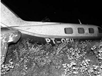
Avião flagrado com droga em Honduras.

Segundo consta, no Brasil os envolvidos adquiriram aeronaves e as adulteravam para transporte de drogas nos outros países. Em São Paulo, além da capital, a operação foi deflagrada em Atibaia, Campinas, Tatuí, Sorocaba, Mogi das Cruzes, Guarulhos e Ribeirão Preto. Deveriam ser efetuadas prisões em Campinas, Sorocaba e na capital paulista.