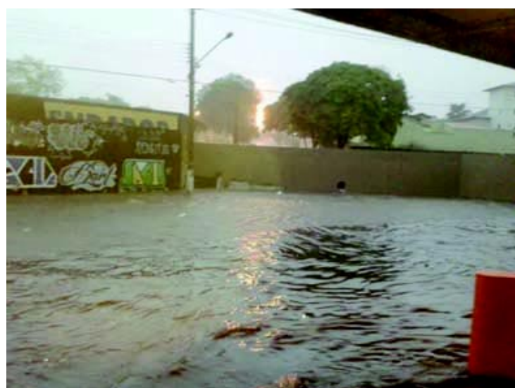
A rodoviária foi inundada com a intensidade da chuva.

Na terça-feira (4), fortes chuvas provocaram estragos em Tatuí. Algumas regiões alagaram. Na Vila Dr. Laurindo, na Avenida Senador Laurindo Dias Minhoto, próximo ao Clube de 3ª Idade, a força da água fez o asfalto ceder e a via pública ficou toda esburacada. Na Vila Menezes, o mesmo acon-