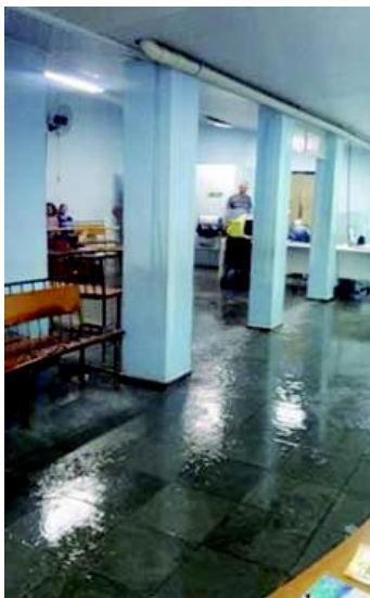
Chuva faz estragos na Santa Casa.

Na terça-feira (4), fortes chuvas provocaram estragos em Tatuí. Algumas regiões alagaram. Na Vila Dr. Laurindo, na Avenida Senador Laurindo Dias Minhoto, próximo ao Clube de 3ª Idade, a força da água fez o asfalto ceder e a via pública ficou toda esburacada. Na Vila Menezes, o mesmo acon-